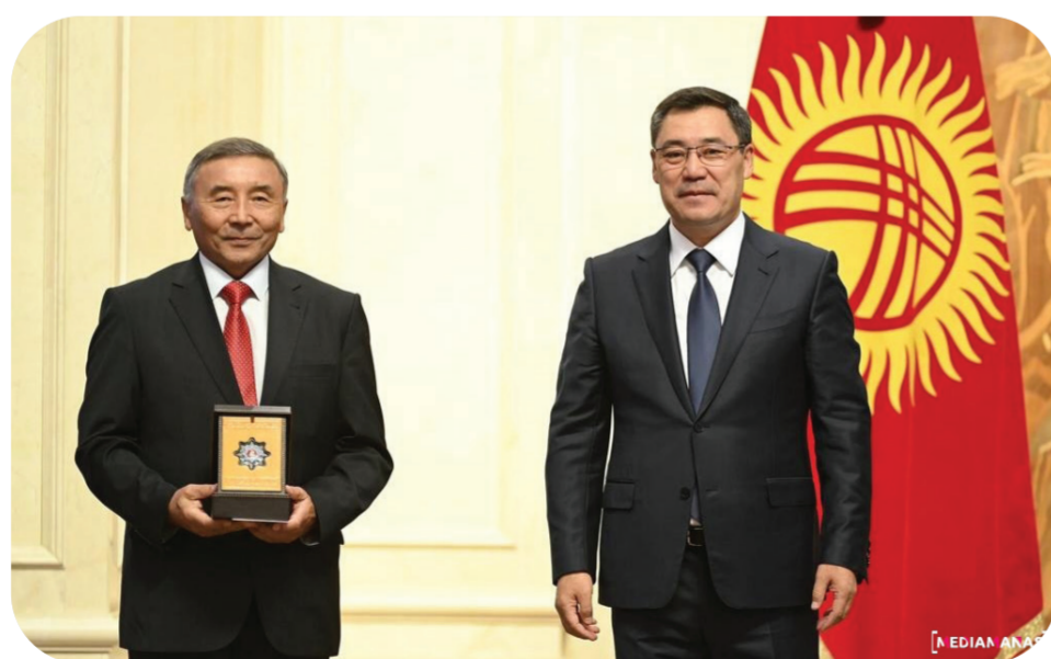
КАБАР: МЕДИАМАНАС

Президент Садыр Жапаров өлкөнүн Эгемендик күнүнө карата Кыргызстандын социалдык-экономикалык, интеллектуалдык жана маданий потенциалын өнүктүрүүгө кошкон олуттуу салымы, кесиптик ишиндеги чоң жетишкендиктери үчүн түрдүү тармактын адистерине мамлекеттик сыйлыктарды тапшырды.