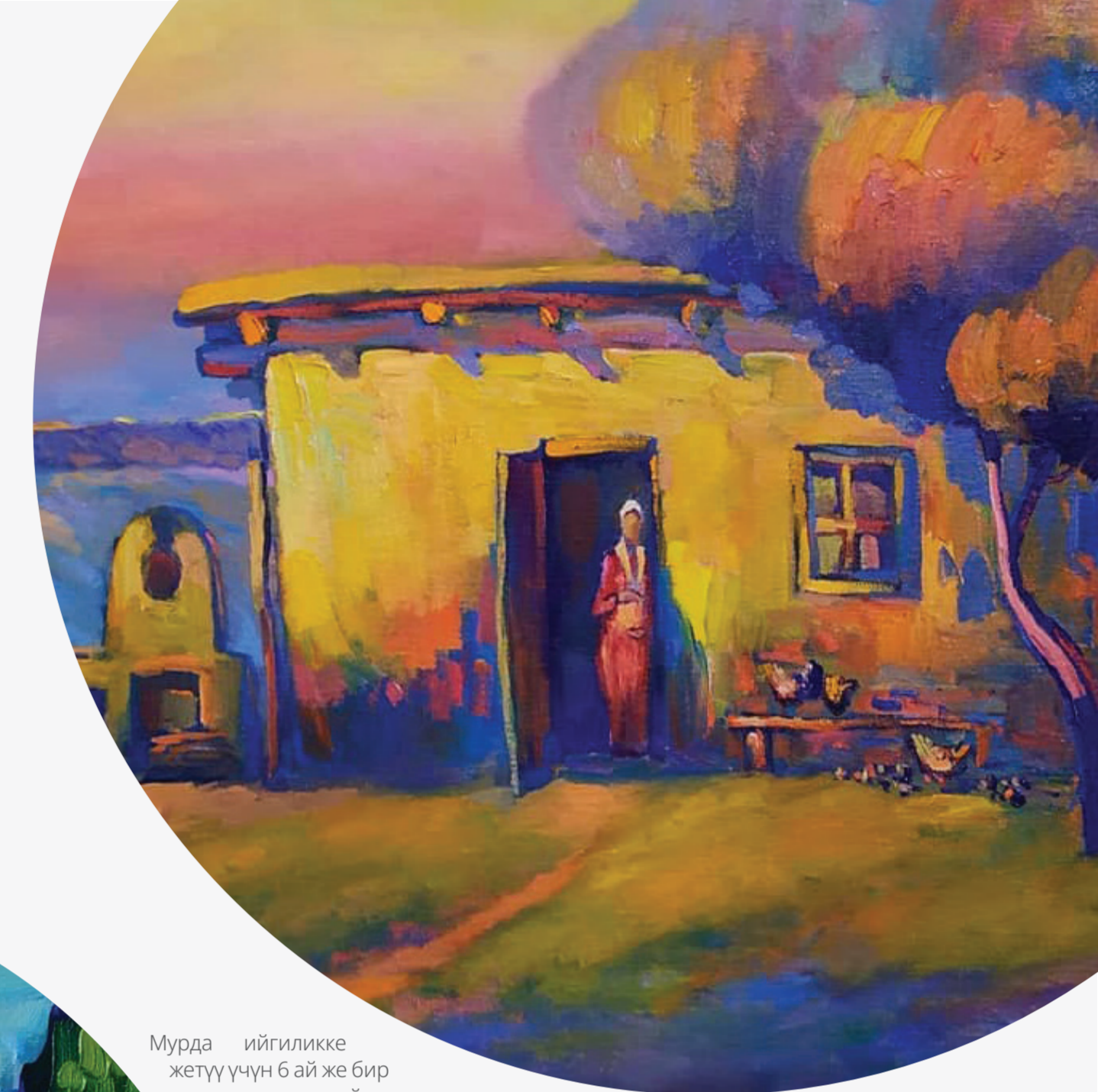
Мурда ийгиликке жетүү үчүн 6 ай же бир жыл керек деп ойлочумун.

Бирок бизнести ийгиликке жетүү үчүн көп жылдарды курмандыкка чалыш керек экенин түшүндүм. Адам курсагы ачса да ишин улантыш керек. Мен буга бөрүкүмдөй эле ишенем. Үзгүлтүксүз жаңы нерсе талап кылынганды, бар нерселерди жоготуп алуу коркунучу да өтө жогору. Биз бир максатка багыт алганда, колдо болгон нерселерди колдонуп ийгиликке жетүүбүз керек. Атактууларды туурабашыбыз керек, антпесек алардын көлөкөсүндө калып кала беребиз. Биздин планетада миллиарддаган адамдар бар болсо да, ар бир адамдын өзгөчөлүгү бар. Мен да өзгөчөлүгүмдү жоготкум келбейт”.